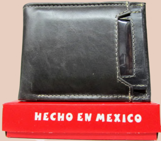
Cartera Piel Caballero línea León Doble Codigo: CHSER16