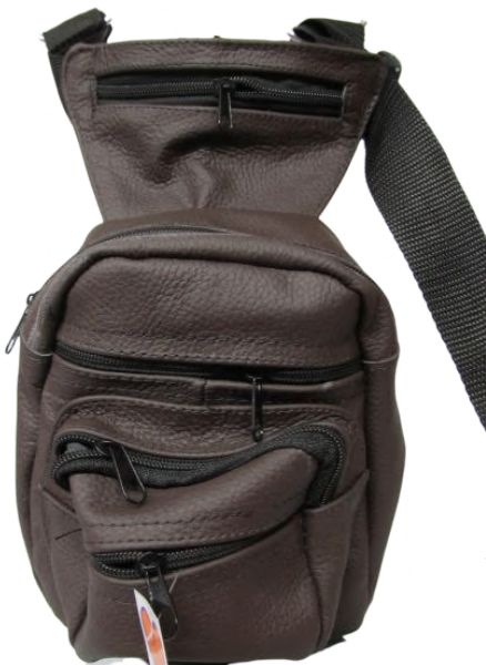
Piernera Piel línea León Codigo: PIE11