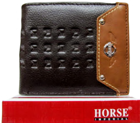
Cartera Caballero línea Horse Doble Codigo: CHBRAN16