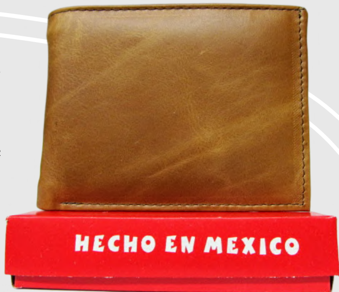
Cartera Piel Caballero línea León Doble Codigo: CHSER06