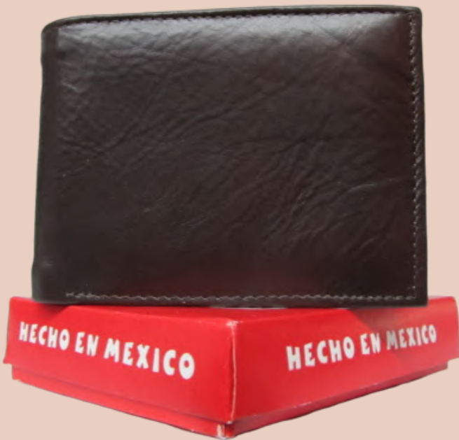
Cartera Piel Caballero línea León Doble Codigo: CHSER02