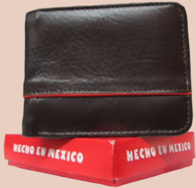
Cartera Piel Caballero línea León Doble Codigo: CHSER05