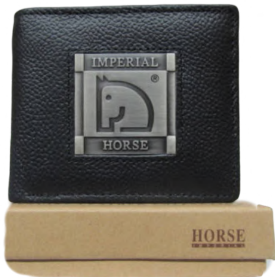
Cartera Caballero linea Horse Negro Doble Codigo: CHBRAN20