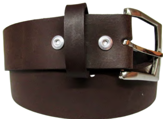
Cinto Caballero linea Fana Cafe Codigo: CIC Talla: 28 al 36 Codigo: CICX Talla: 38 al 46 Ancho: 37 MM