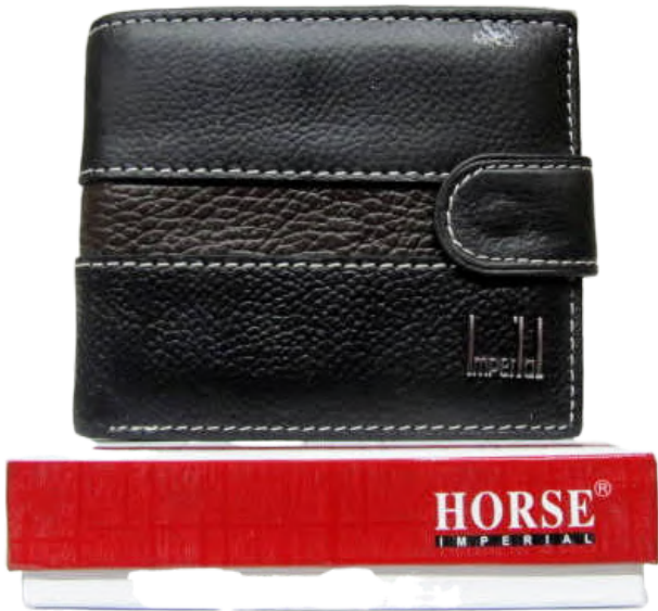
Cartera Caballero linea Horse Negro Doble Codigo: CHBRAN01