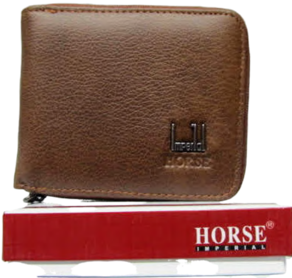
Cartera Caballero línea Horse Doble Codigo: CHBRAN08