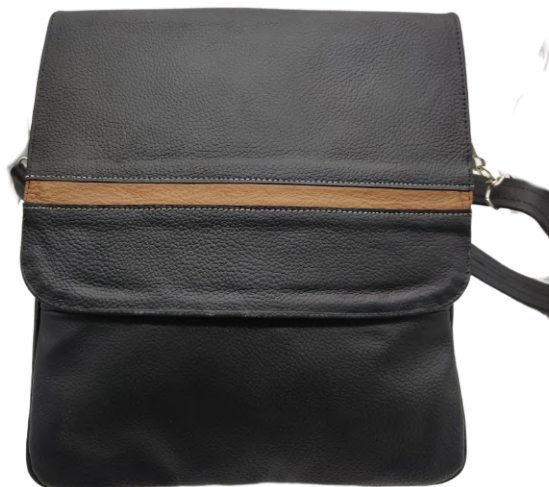
Mariconera Piel Tapa Grande linea Fana Negro Codigo: MAP01 Medidas: 30 x 25 x 10 cm.