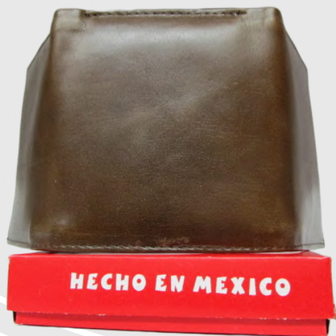
Cartera Piel Caballero línea León Triple Codigo: CHSER11