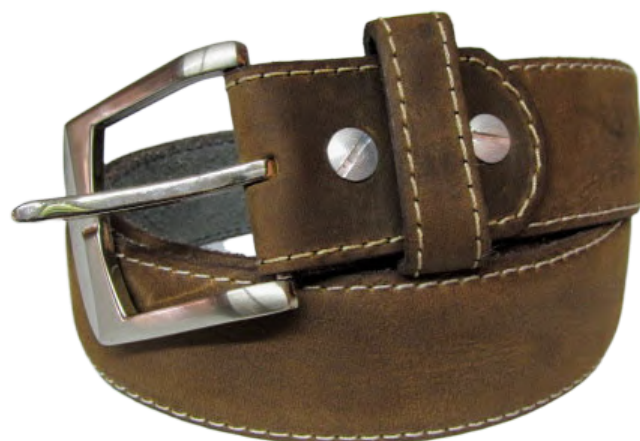
Cinto Caballero linea Fana Camel Codigo: CIN Talla: 28 al 36 Ancho: 37 MM