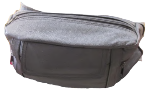
Cangurera Piel línea León Codigo: CANG05