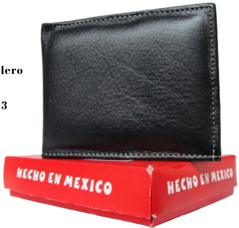
Cartera Piel Caballero línea León Doble Codigo: CHSER03