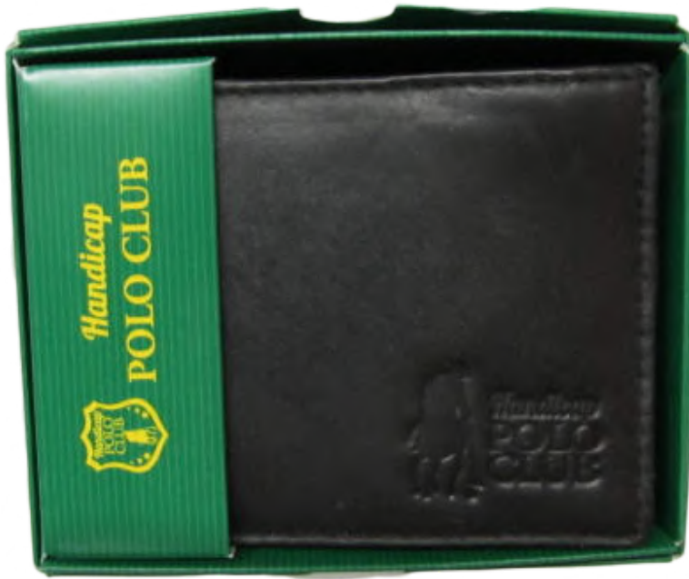
Cartera Caballero linea Plus Negro Doble Codigo: CHPL01