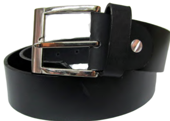
Cinto Caballero linea Fana Negro Codigo: CIN Talla: 28 al 36 Codigo: CINX Talla 38 al 46 Ancho: 37 MM