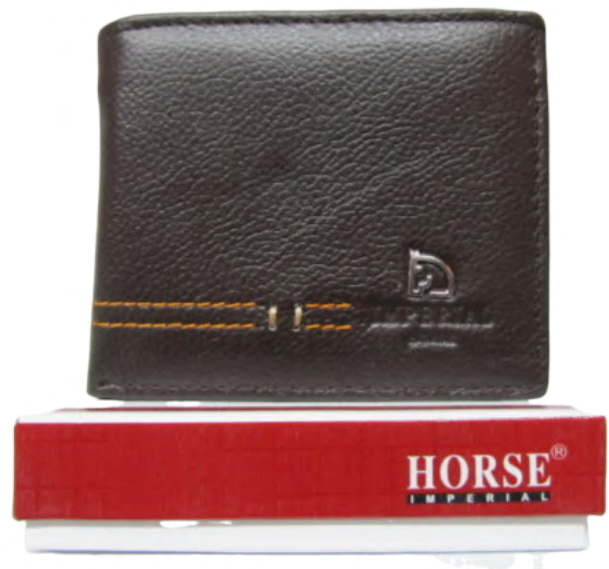
Cartera Caballero línea Horse Doble Codigo: CHBRAN04