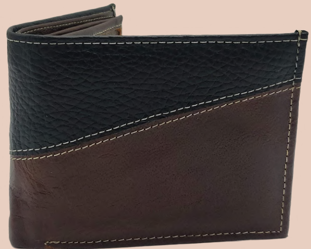
Cartera Piel Caballero línea León Doble Codigo: CHSER17