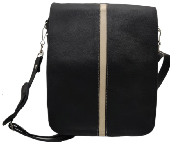
Mariconera Piel Tapa Mediana linea Fana Negro Codigo: MAP02 Medidas: 27 x 11 x 8 cm.