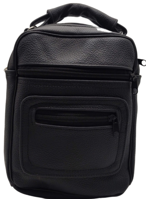
Mariconera Piel Miloso linea Fana Negro Codigo: MAP05 Medidas: 23 x 17 x 8 cm.