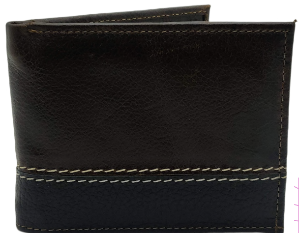
Cartera Piel Caballero línea León Doble Codigo: CHSER14