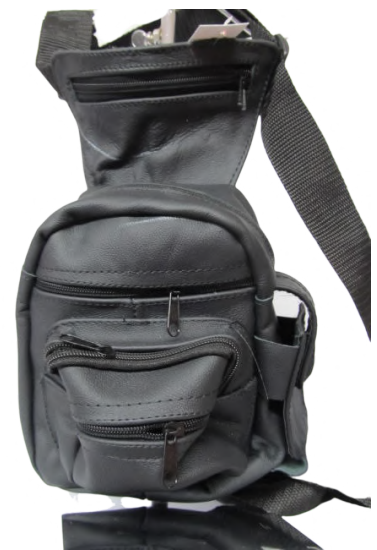
Piernera Piel línea León Codigo: PIE21