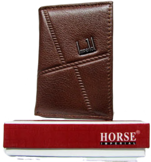
Cartera Caballero línea Horse Triple Codigo: CHBRAN15