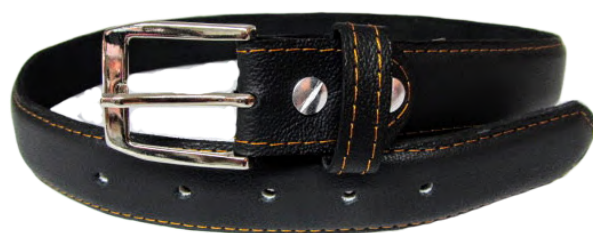
Cinto Niño linea Fana Negro Codigo: CIN Talla: 28 al 36 Ancho: 30 MM