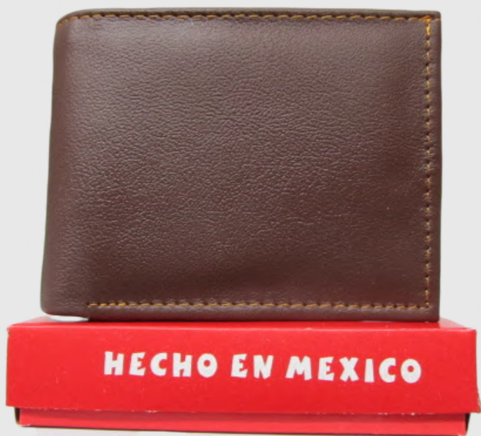
Cartera Piel Caballero línea León Doble Codigo: CHSER21