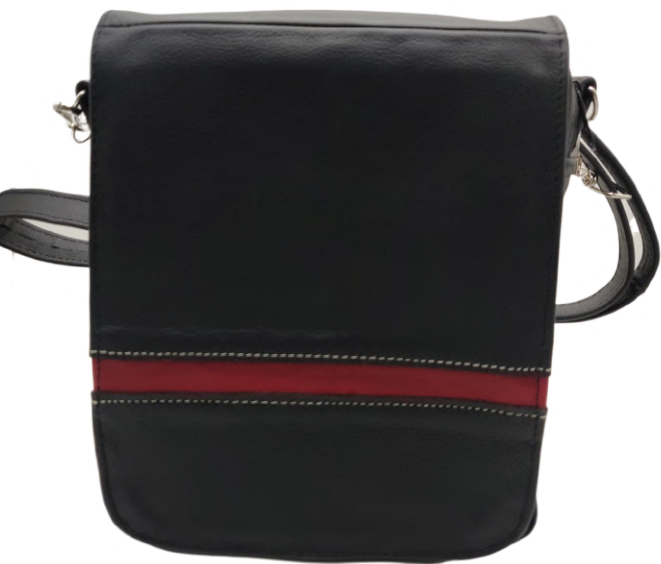
Mariconera Piel Tapa Chica linea Fana Negro Codigo: MAP03 Medidas: 20 x 17 x 8 cm.