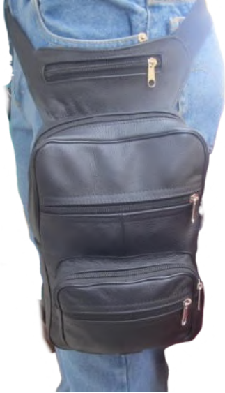
Piernera Piel línea León Codigo: PIE04