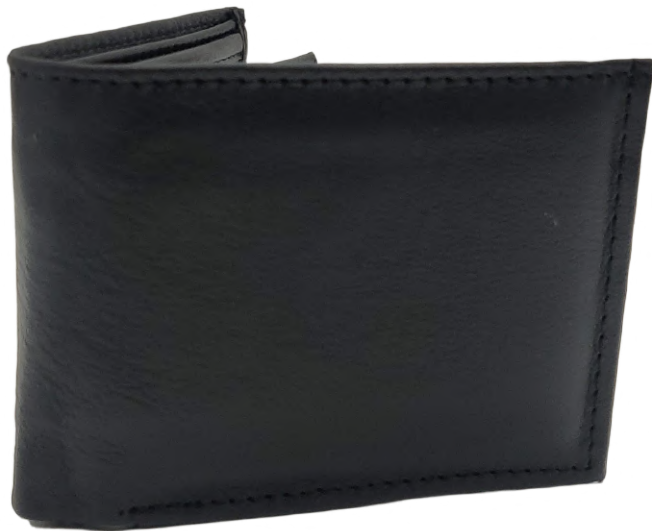
Cartera Piel Caballero línea León Doble Codigo: CHSER04