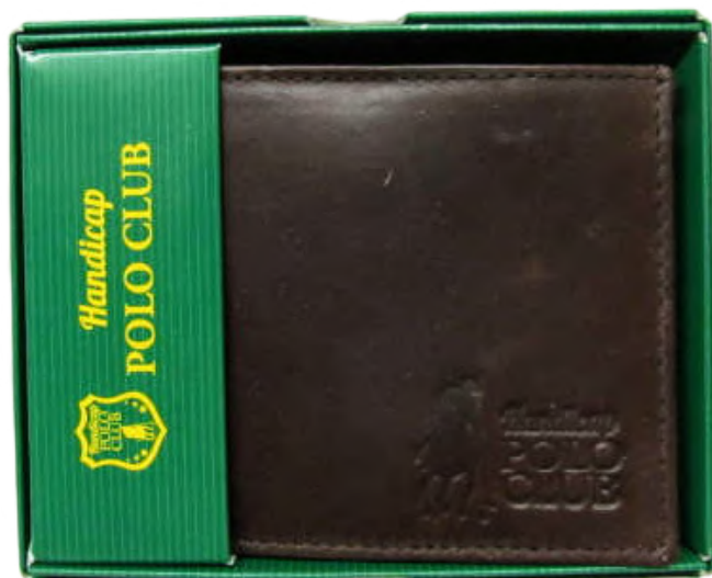
Cartera Caballero linea Plus Cafe Doble Codigo: CHPL02