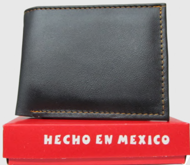
Cartera Piel Caballero línea León Doble Codigo: CHSER08