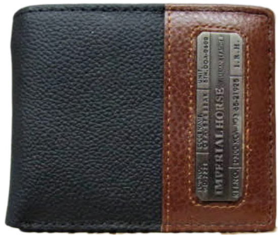
Cartera Caballero linea Horse Negro Doble Codigo: CHBRAN18